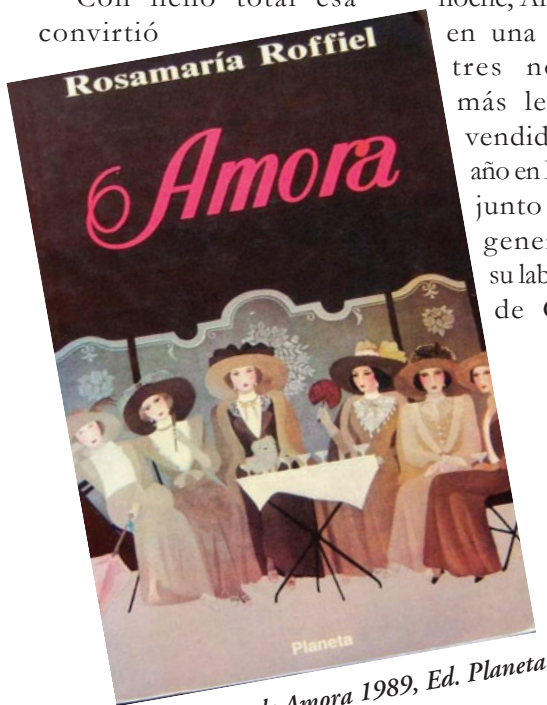
1a Edición de Amora 1989, Ed. Planeta

en una de las tres novelas más leídas y vendidas ese año en México, junto a "El general en su laberinto" de García